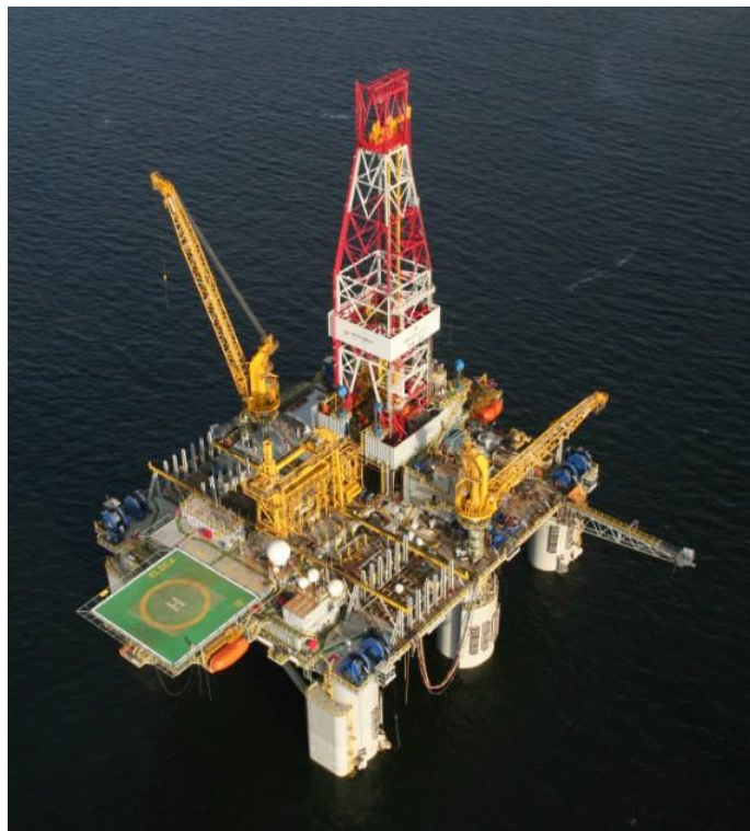
“Olinda Star” - Sonda de perfuração semissubmersível da Queiroz Galvão

A Karoon Gás Austrália (“Karoon”) tem o prazer de anunciar que espera começar a campanha de perfuração de 2-4 poços de avaliação e exploração durante a segunda semana de novembro de 2014. O objetivo primário dessa campanha é perfurar um poço de avaliação de baixo risco na descoberta de petróleo Kangaroo.